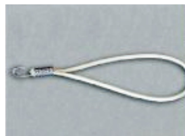
Elástico con Gancho Metálico