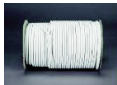
Bobina Cordón Elástico