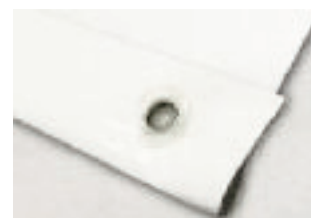
Cinta Doble Cara 2