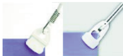
Pinzas Reutilizables MINI