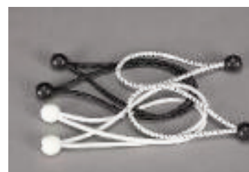
Elásticos con bola