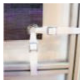
Cintas de Poliéster 600mm con Hebilla