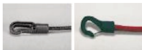
Gancho Plástico para Cordón (8mm diámetro)