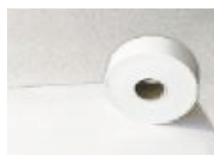
Refuerzo soldar/coser para Lonas