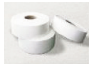
Refuerzo Autoadhesivo para Lonas