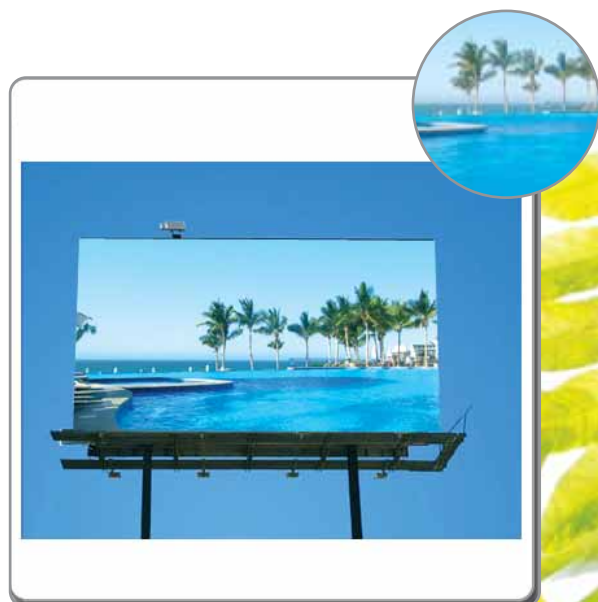
* Valla Publicitaria *