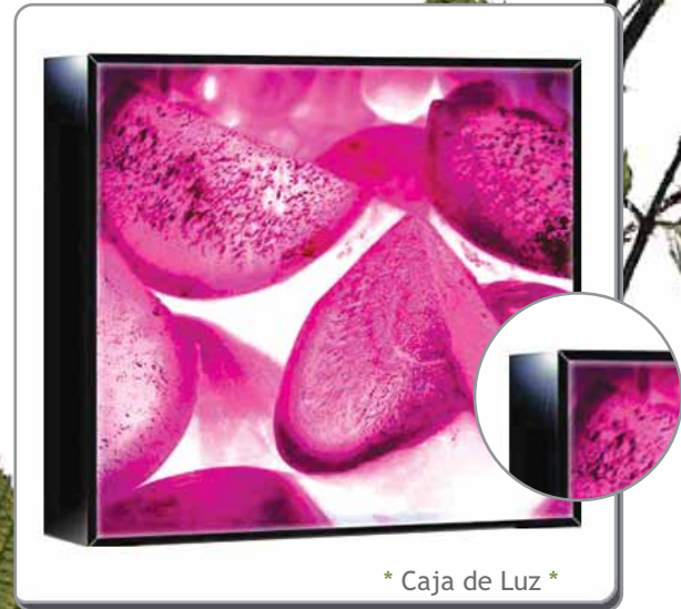
* Caja de Luz *

DENIER: 150D GROSOR: 0,20mm PESO: 130GR.