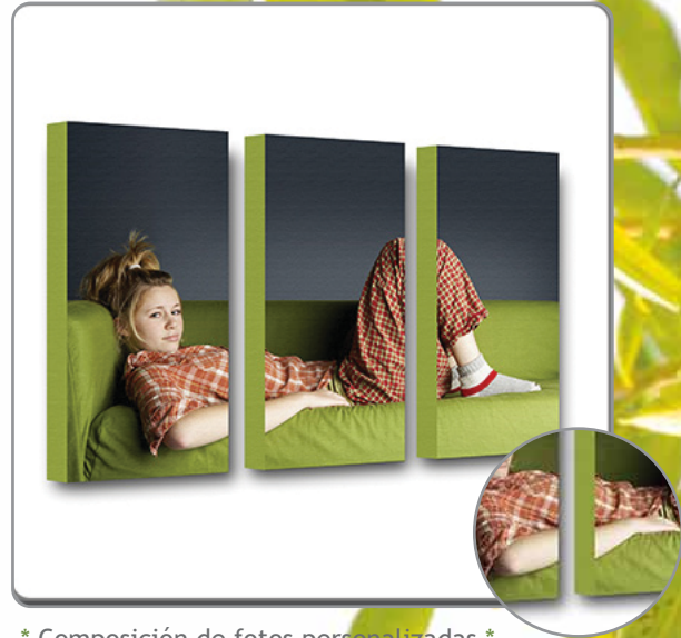
* Composición de fotos personalizadas *