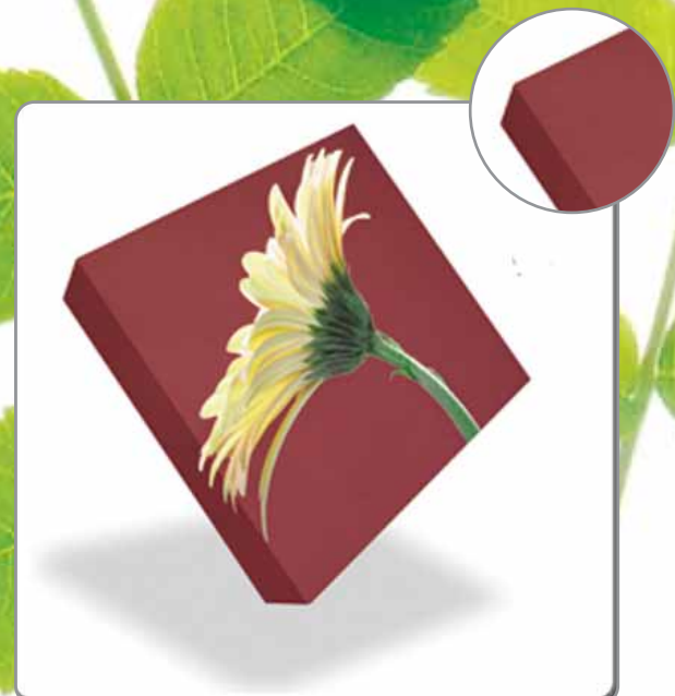
* Fotos en cuadros personalizados *