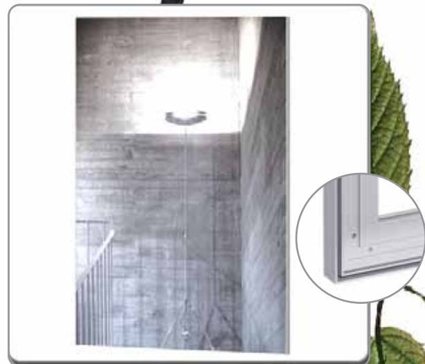
* Perfil de Aluminio *

DENIER: 300D GROSOR: 0,30mm PESO: 195GR.