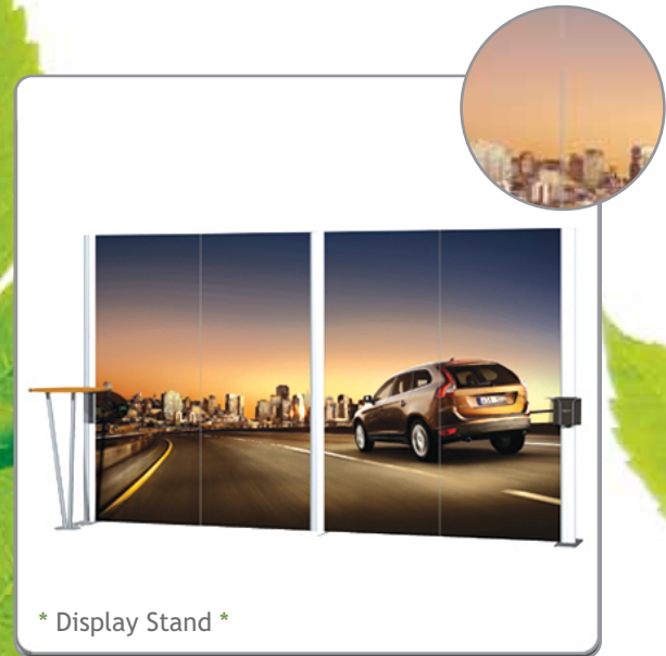
* Display Stand *

*Pedidos en ancho 1,05 debe ser múltiplos de 3 uds y en 1,6 múltiplos de 2 uds*